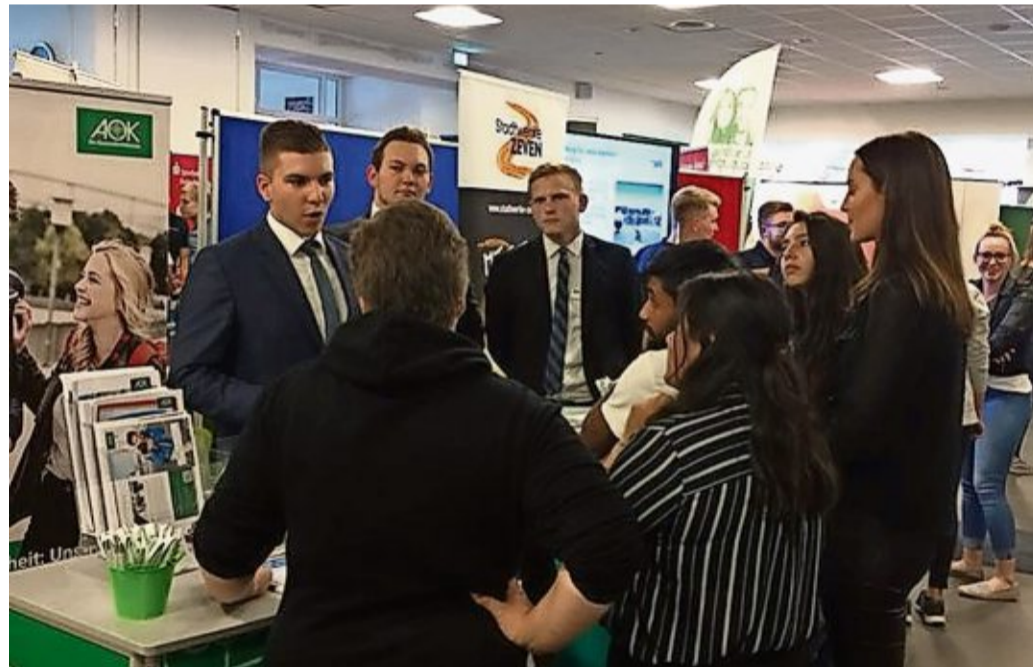
Die Ausbildungsplatzangebote reichen von kaufmännischen über handwerkliche bis hin zu technischen Berufen.