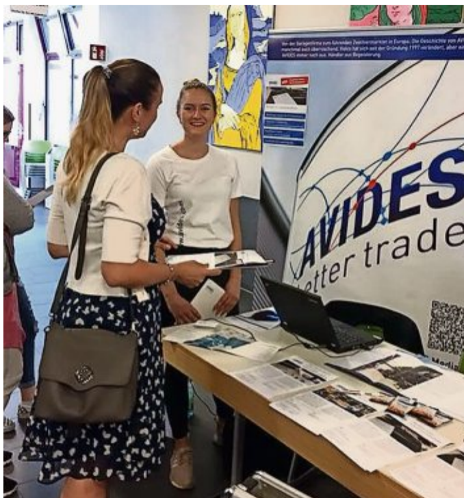
An zahlreichen Ständen präsentieren sich Firmen und beantworten Fragen rund um Ausbildung, Bewerbung und Praktikum.