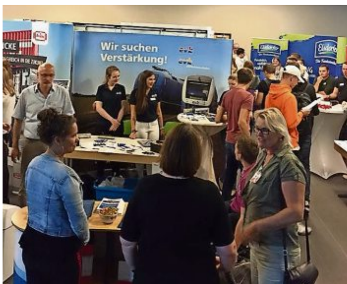
Bei der Ausbildungsplatzbörse am 12. September werden wichtige Gespräche geführt.

Ausbildungsplatzsuchende können gerne auch schon Bewerbungsunterlagen zur ZAB mitbringen. Freie Ausbildungsstellen einiger Betriebe sind bereits auf der Facebookseite des Kivinan Bildungszentrums zu finden.