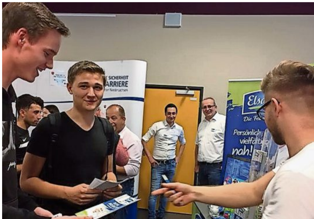
Die Zevener Ausbildungsplatzbörse hält für junge Menschen, die die Schule demnächst abschließen, berufliche Perspektiven bereit.